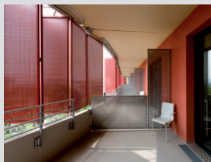
Eine Soft-Anlauf- und Soft-Stopp-Automatik gewährleistet eine sanfte und geräuscharme Bewegung der Lamellen

Das neue Pflegewohnhaus im Wiener Bezirk Meidling gehört zu einem modernen Geriatrie-Konzept der österreichischen Hauptstadt. Wohnortnahe Pflegeeinrichtungen für ältere Menschen ersetzen nach und nach die einstigen „Altenheime“. Der Baukörper besticht durch seine geschwungene Form und eine besonders gelungene Verbindung aus Offenheit und geschützter Intimität. Einen wichtigen Beitrag hierzu leisten Falt-Schiebe-Läden aus Aluminium,